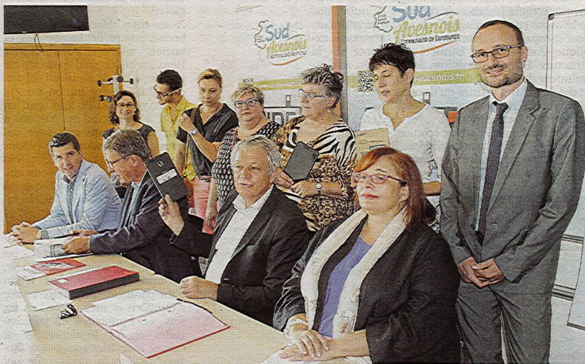
Les premières tablettes numériques ont été distribuées aux infirmiers libéraux.

spécialistes maubeugeois (diabétologue, gastro-entérologue, neurologue et pneumologue) seront de plus en plus présents ».