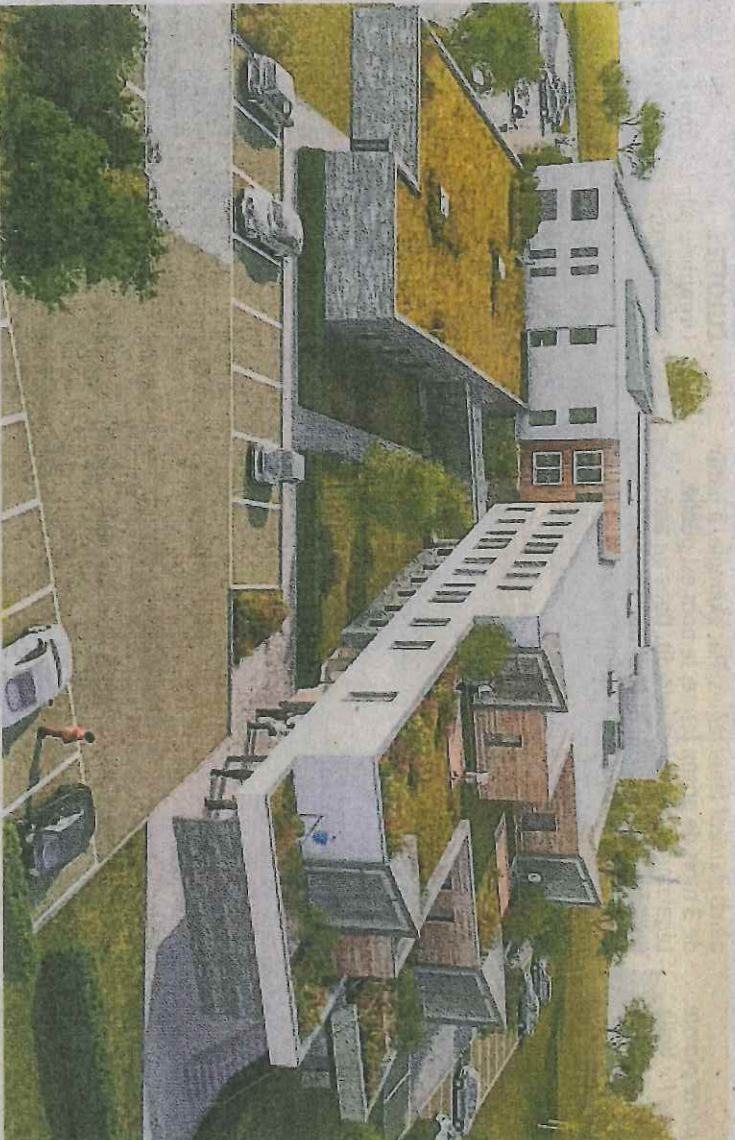
L'inauguration devait avoir lieu en décembre 2016.

Les travaux de la nouvelle maison de santé pluridisciplinaire d'Auxi, et de ses 24 logements, touchent à leur fin. Les élus avaient organisé une première visite du chantier, quelques mois avant l'ouverture de ce complexe innovant.