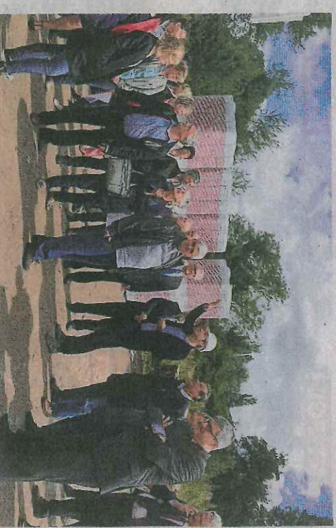
L'architecte a expliqué ses choix de conception et de matériaux, le tout dans un respect de l'environnement optimum.